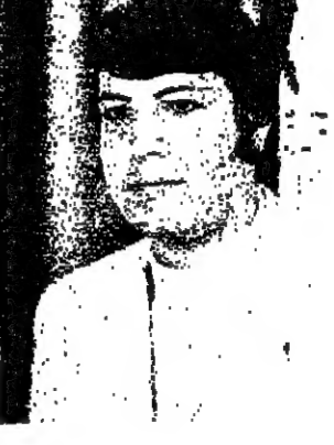
هني خروب نصو ادارة